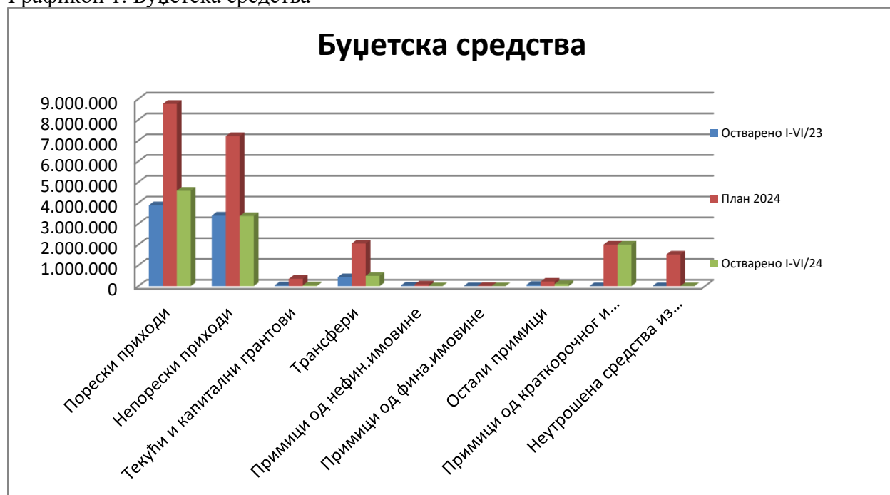
Графикон 1. Буџетска средства